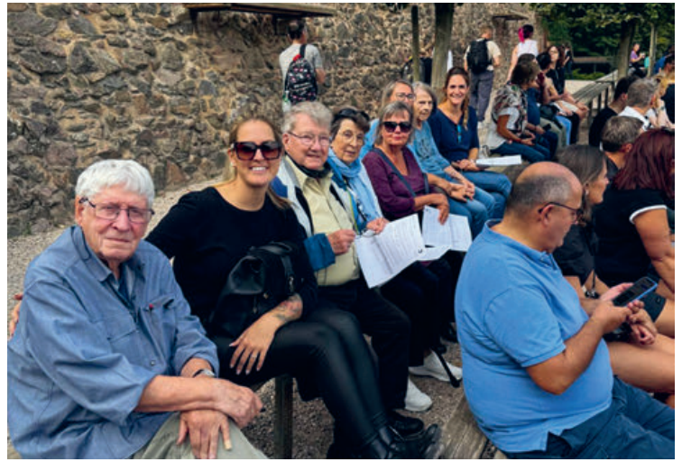
Vogelschau in der Greifvogelwarte Kintzheim