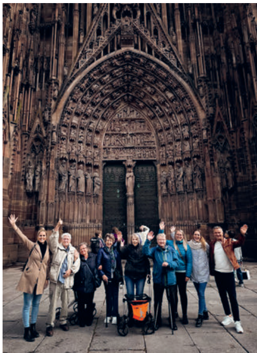
Besuch Cathédrale Notre-Dame de Strasbourg