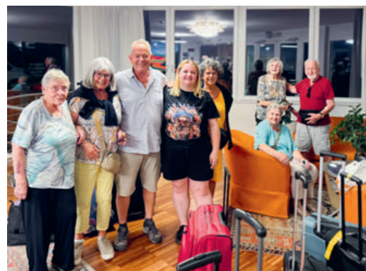
Nach 11-stündiger Reise AnkuNt im Hotel in Arco