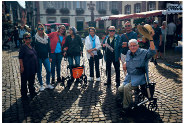
Ausflug nach Ribeauvillé