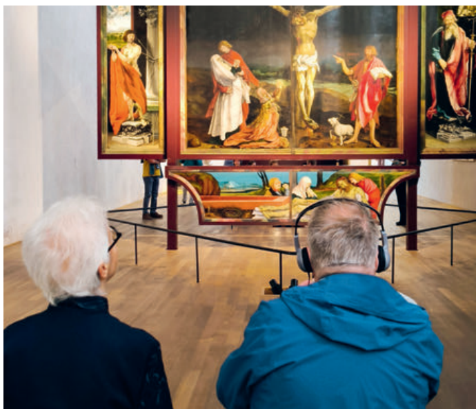
Senioren bestaunen den Isenheimer Altar im Unterlinden Museum in Colmar