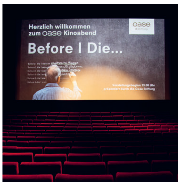
Standbild vom Kinoabend im Arthouse Le Paris in Zürich

Es ist leicht, sich im Alltag zu verzetteln und zu vergessen, was einem wirklich wichtig ist. Die «Before I die»-Wand lädt Menschen jeden Alters dazu ein, zu hinterfragen, was sie in der ihnen verbleibenden Zeit auf dieser Erde noch tun und erleben möchten.